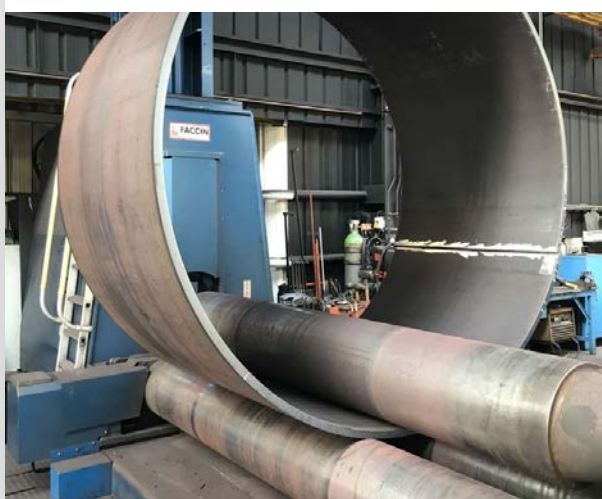
opérations de roulage